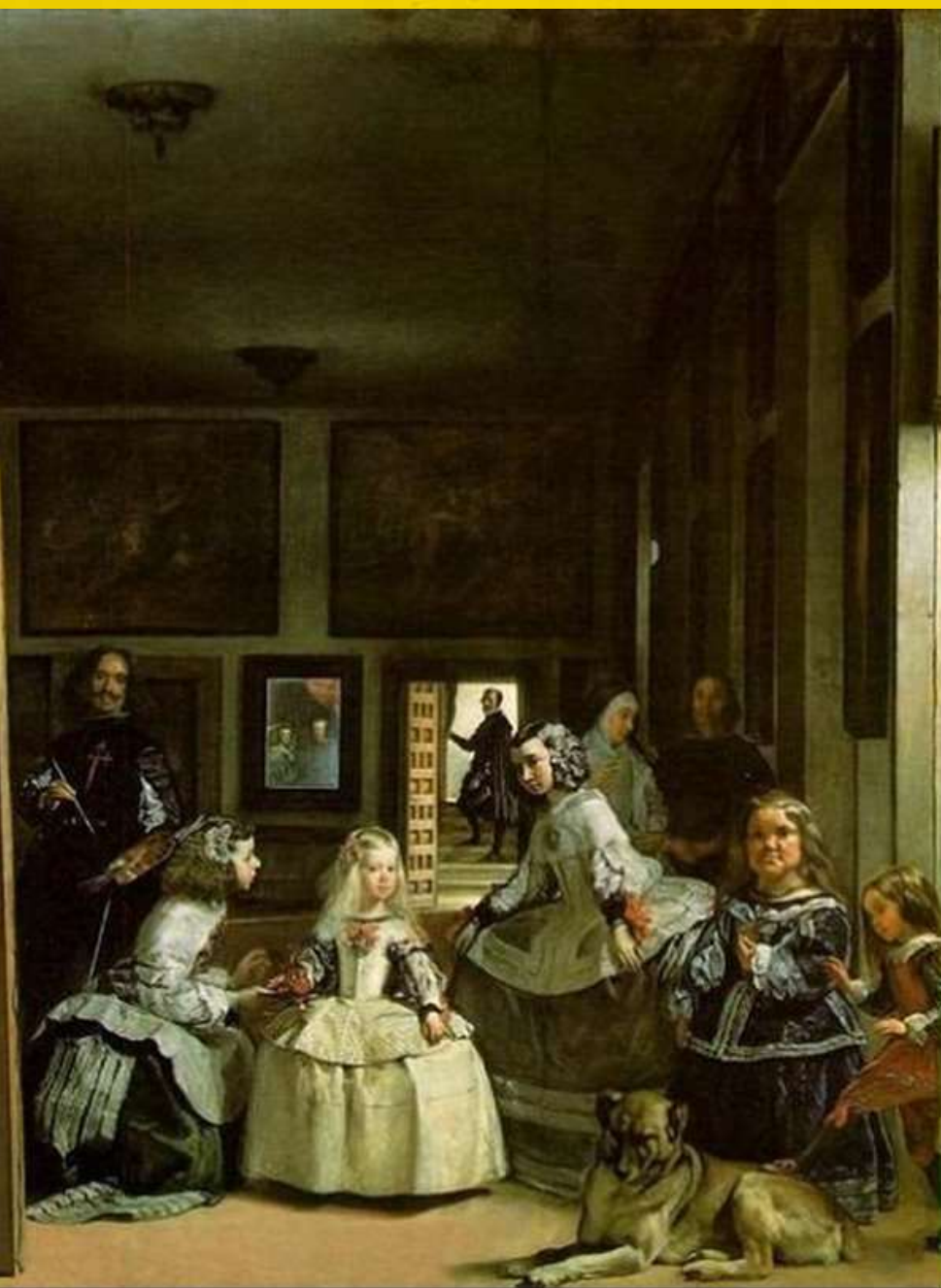
El Greco. Las Meninas