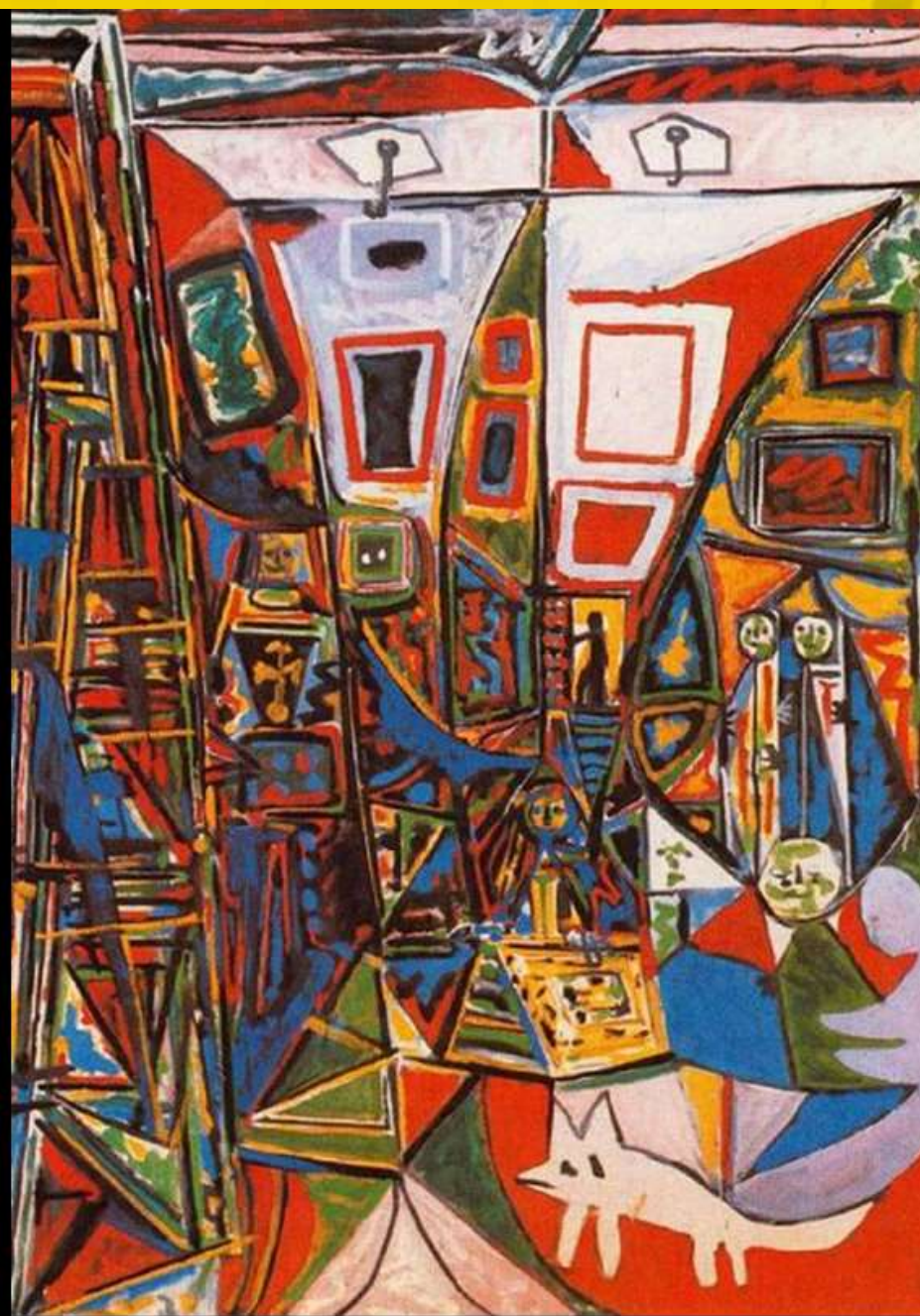
Picasso. Las Meninas (versión colorista)