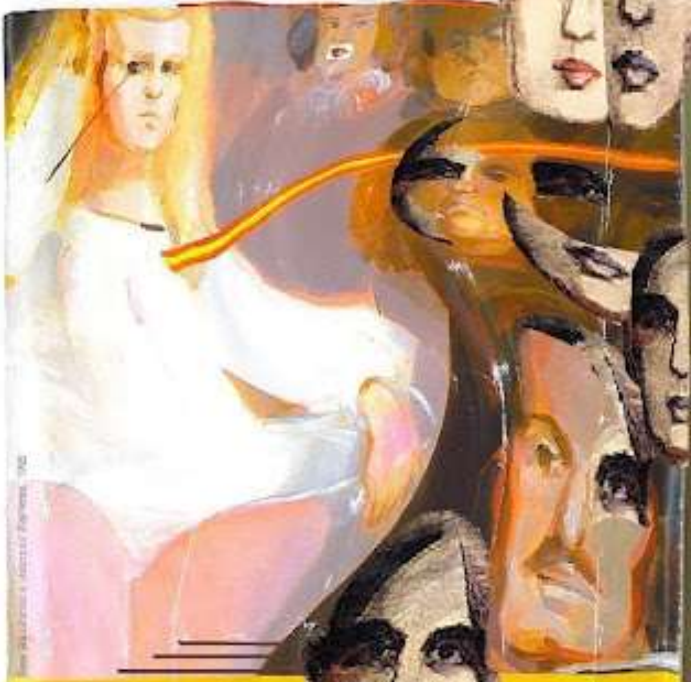
Francis Bacon, "The Artist's Mother", 1962